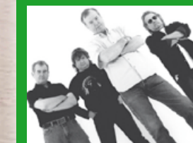
So 4.3. Animals & Friends (UK)