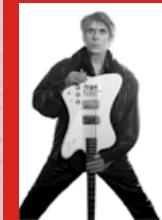
Fr 18.11. Martin Turner's Wishbone Ash