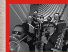
22.01. Chianti Protokoll