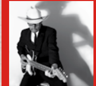
Mi 19.10. The Pretty Things (GB)