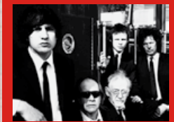
So 23.10. Andy Fairweather Low (GB)